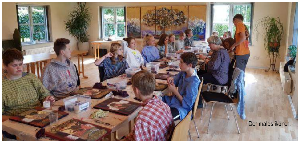
Der males ikoner.

Kr. Himmelfarts dag torsdag den 10 maj kl. 10.00 kommer da sandsynligvis på tale, vedkommende familier vil blive spurgt, hvad der passer bedst.