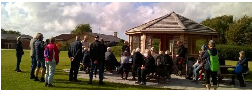
Kirkevandring forbi Bytorvet i Tæbring