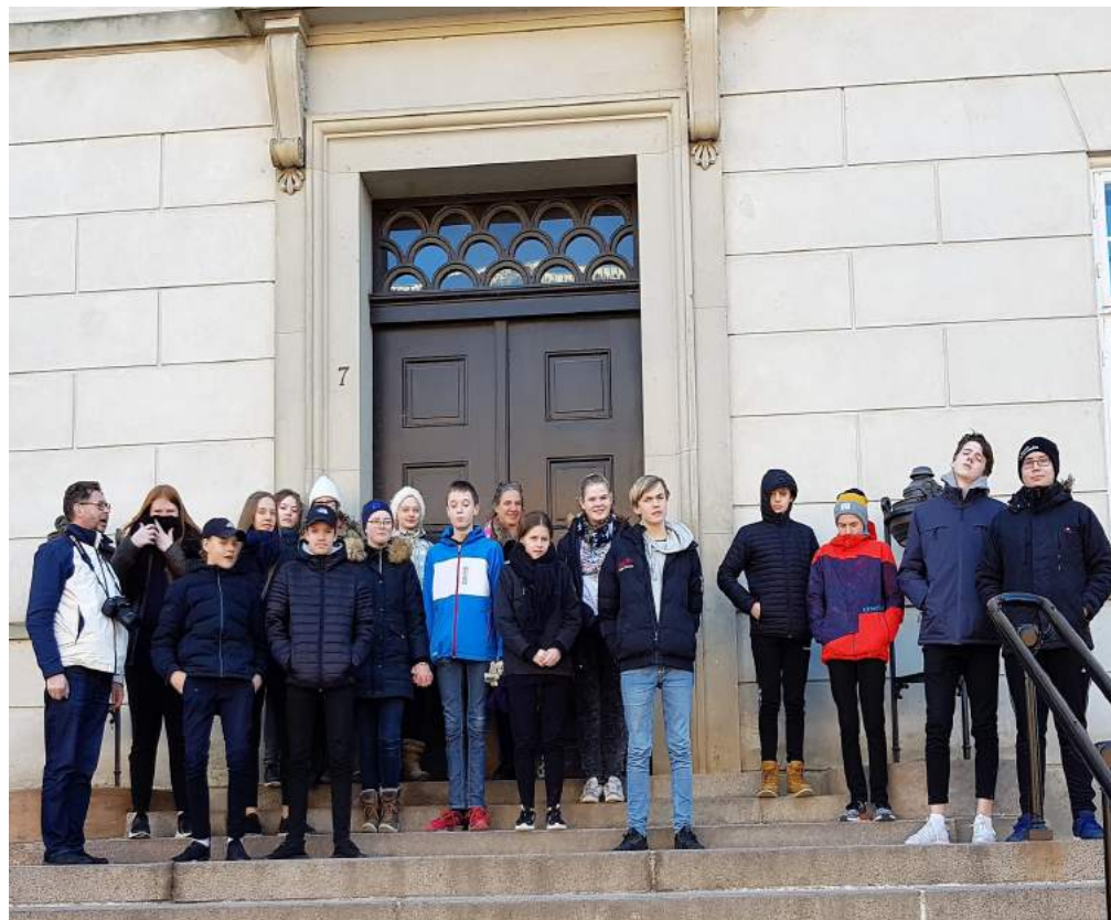
Konfirmander udenfor Sorø Akademi - Konfirmandtur til København Marts

Agerø - Hvidbjerg - Karby Rakkeby - Redsted - Tæbring