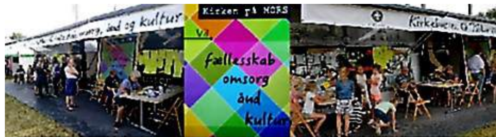
Kirkebussen på Kulturmødet, Mors.