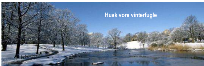
Husk vore vinterfugle