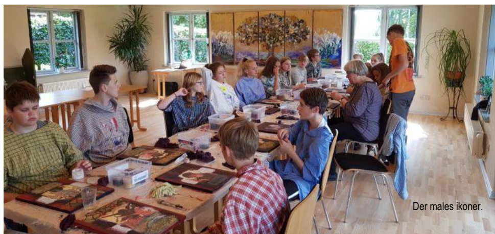
Der males ikoner.

Kr. Himmelfarts dag torsdag den 10 maj kl. 10.00 kommer da sandsynligvis på tale, vedkommende familier vil blive spurgt, hvad der passer bedst.