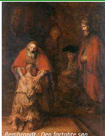
Rembrandt : Den fortabte søn

Se også læseplanen på hjemmesiden www.svmp.dk eller tag en folder i våbenhuset i Karby kirke.