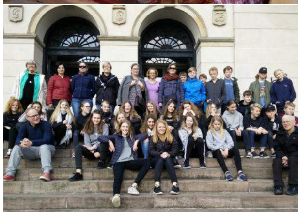
Københavnertur i foråret sammen med konfirmander fra Frøslev