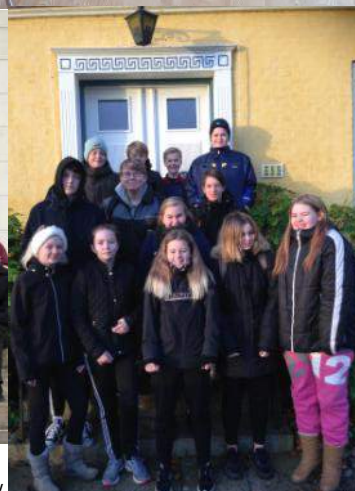
Konfirmander i Karby