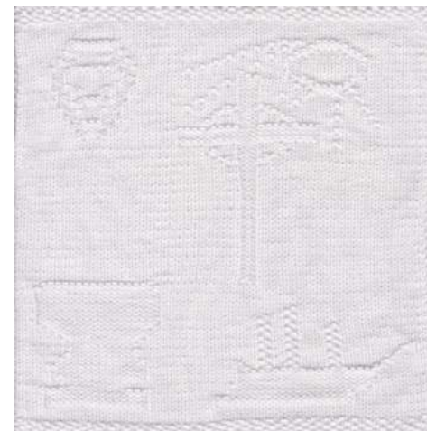
Symbolerne fra kirkerne anes på billedet af dåbskluden ovenfor. De ses tydeligere når man har kluden i hånden.

Frøslev kirke: Kirkeskibet er fra omkring 1770, og er dermed det ældste på Mors.